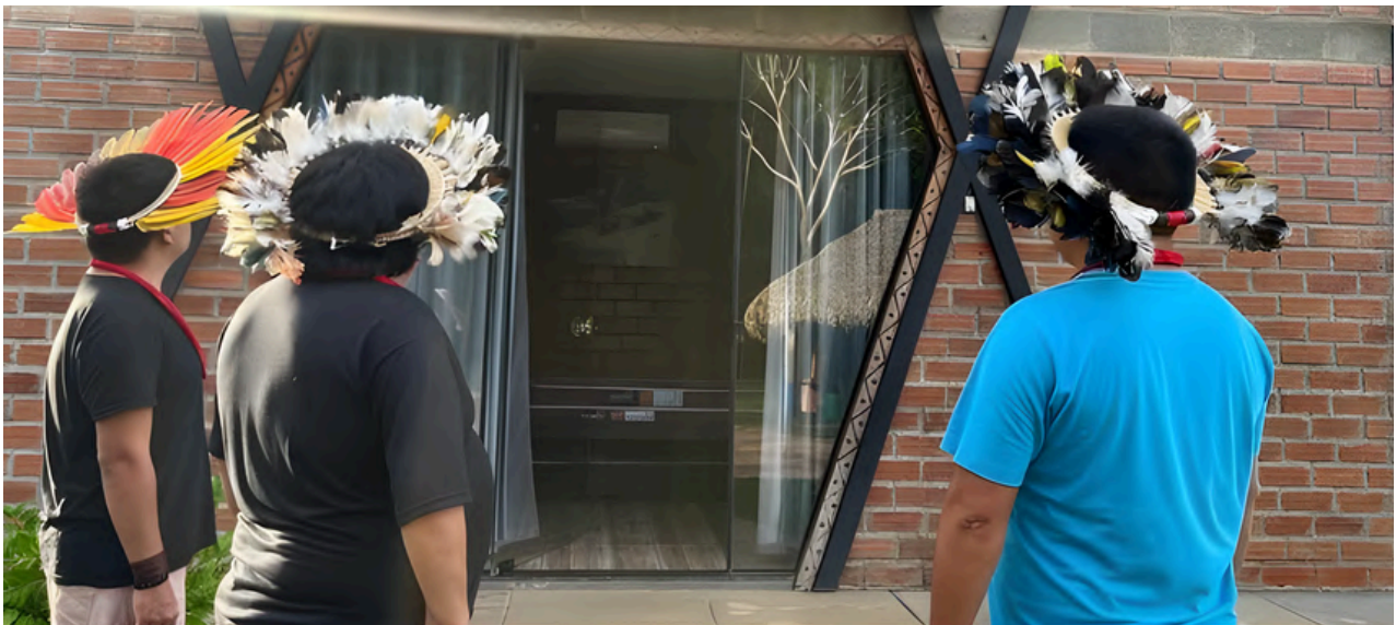
El Pueblo Indígena Paiter Suruí concibió y creó la primera agencia de etnoturismo en Brasil

alimentos, respetando el bosque y los ríos. La naturaleza no es un recurso a ser explotado, sino una entidad viva de la cual formamos parte. Estos pueblos son cuidadores de la Tierra, un bien sagrado heredado de los ancestros y destinado a las futuras generaciones. Como enseña Ailton Krenak, importante líder indígena brasileño, necesitamos crear “paracaídas de colores”, asumiendo prácticas agroecológicas con producción y consumo de lo esencial y no del desperdicio.