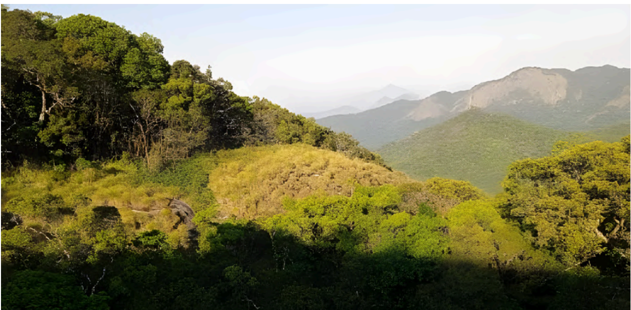
Mount Mabu, a 1 700 metros de altitud, cubre un área de 7 880 hectáreas y es un bosque sagrado — casi intacto y protegido por las comunidades locales. https://www.biofund.org/mz/promove-biodiversidade-monte-mabu-uma-floresta-sagrada-e-fascinante/

La educación tiene un papel relevante, promoviendo cambios curriculares de tal forma que los contenidos de las disciplinas, estudiados de manera articulada, tengan como propósito la lectura crítica de la realidad [Freire, 1979]. Es necesario que la información sea conocida por docentes y estudiantes, especialmente para la concientización sobre situaciones que