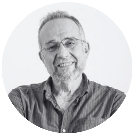
Pedro Arrojo Agudo

Pedro es doctor en ciencias físicas y profesor de la Universidad de Zaragoza, cuya investigación está centrada en la economía del agua. Desde noviembre de 2020 es el Relator Especial en las Naciones Unidas sobre los derechos humanos al agua potable y al saneamiento.