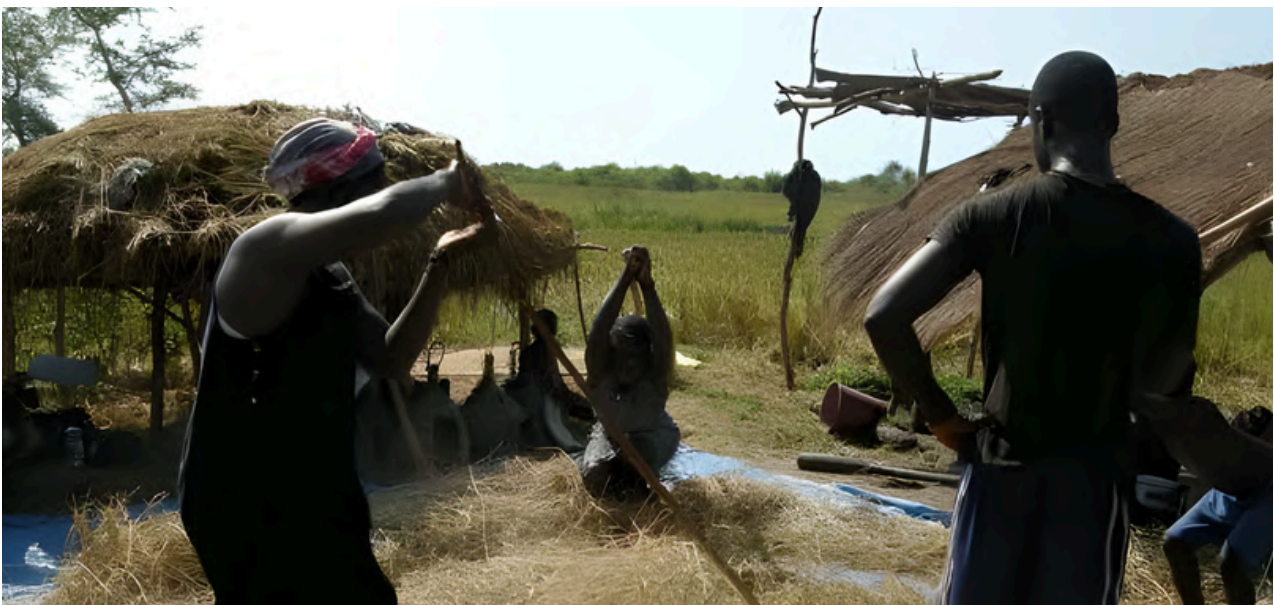
La etnia Bijagó da nombre al grupo de 80 islas que conforman el Archipiélago de Bijagós, frente a la costa occidental de África, clasificado por la UNESCO en 1996 como Reserva de la Biosfera. Su modo de vida, desarrollado en armonía con la naturaleza, explica su estado de conservación. https://www.geledes.org.br/bijagos-sociedade-matriarcal/

Los pueblos indígenas brasileños muestran caminos de equilibrio con la naturaleza. El pueblo Paiter Suruí, de Rondonia [Brasil], desarrolla prácticas agroecológicas para la producción de café, castaña y otros